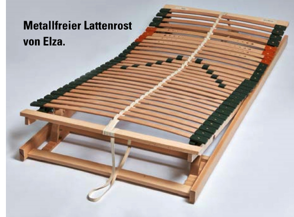
Metallfreier Lattenrost von Elza.